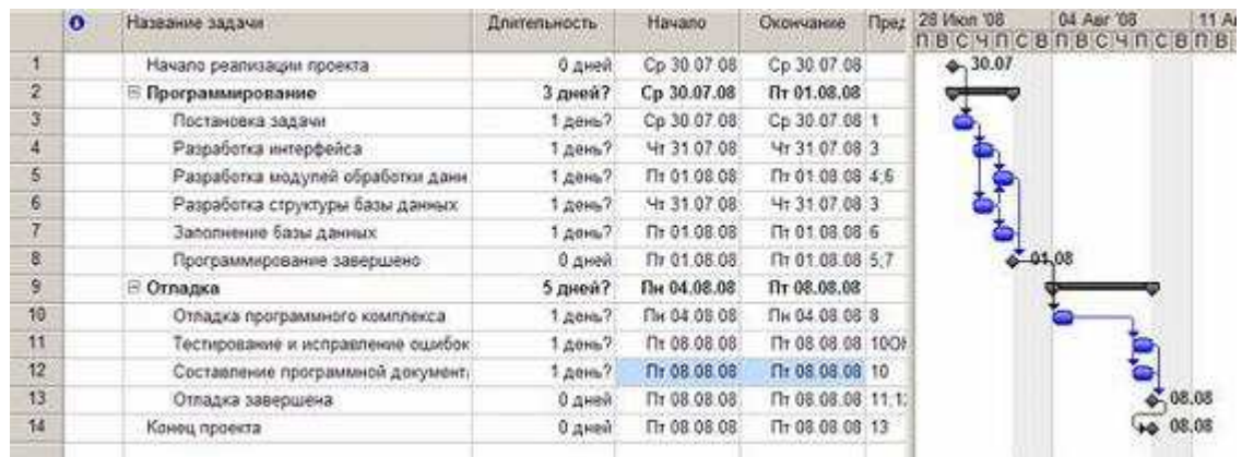
Рис. Результат преобразований